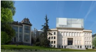
Huis van de Europese Geschiedenis. Foto gebouw: Michel Polak (1935). Architect Chaix & Morel (2000)

Op 4 mei is het Huis van de Europese geschiedenis in Brussel officieel geopend. In dit nieuwe museum, opgericht door het Europees Parlement, heeft Kossmann.dejong samen met tentoonstellingsbouwer Bruns, interactieontwerper Kiss the Frog en audiovisueel ontwerper Shosho de eerste tijdelijke tentoonstelling 'Interactions: centuries of commerce, combat and creation' gecreëerd.