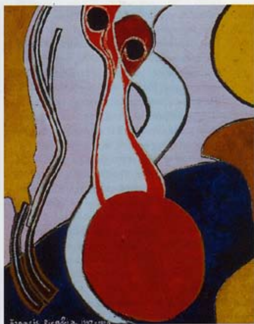
Francis Picabia, 'Danger de la Force', 1947-50, olieverf op doek, 120 x 96 cm

Het ontstaan der dingen plaats Museum Boijmans Van Beuningen, Rotterdam van 10 mei t/m 27 juli